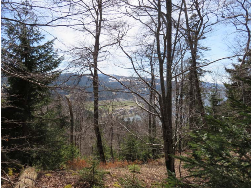
Sommet des Agouillons et forêt profonde.