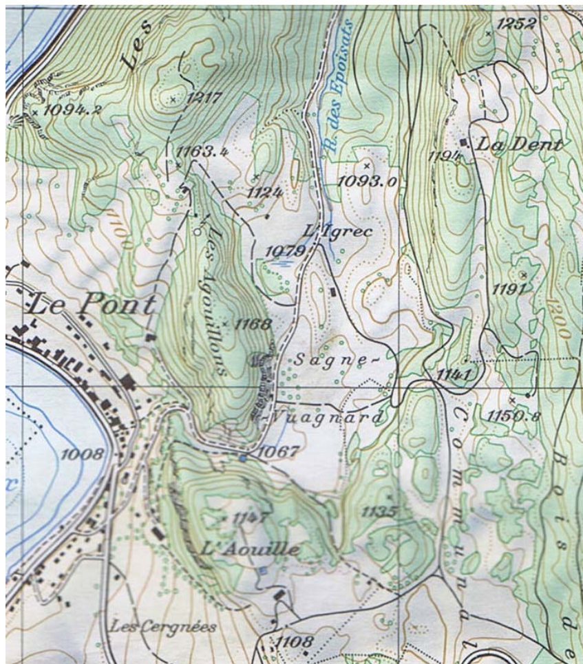
Carte fédérale de 1986. La ferme des Agouillons se situait sur le point 1163.