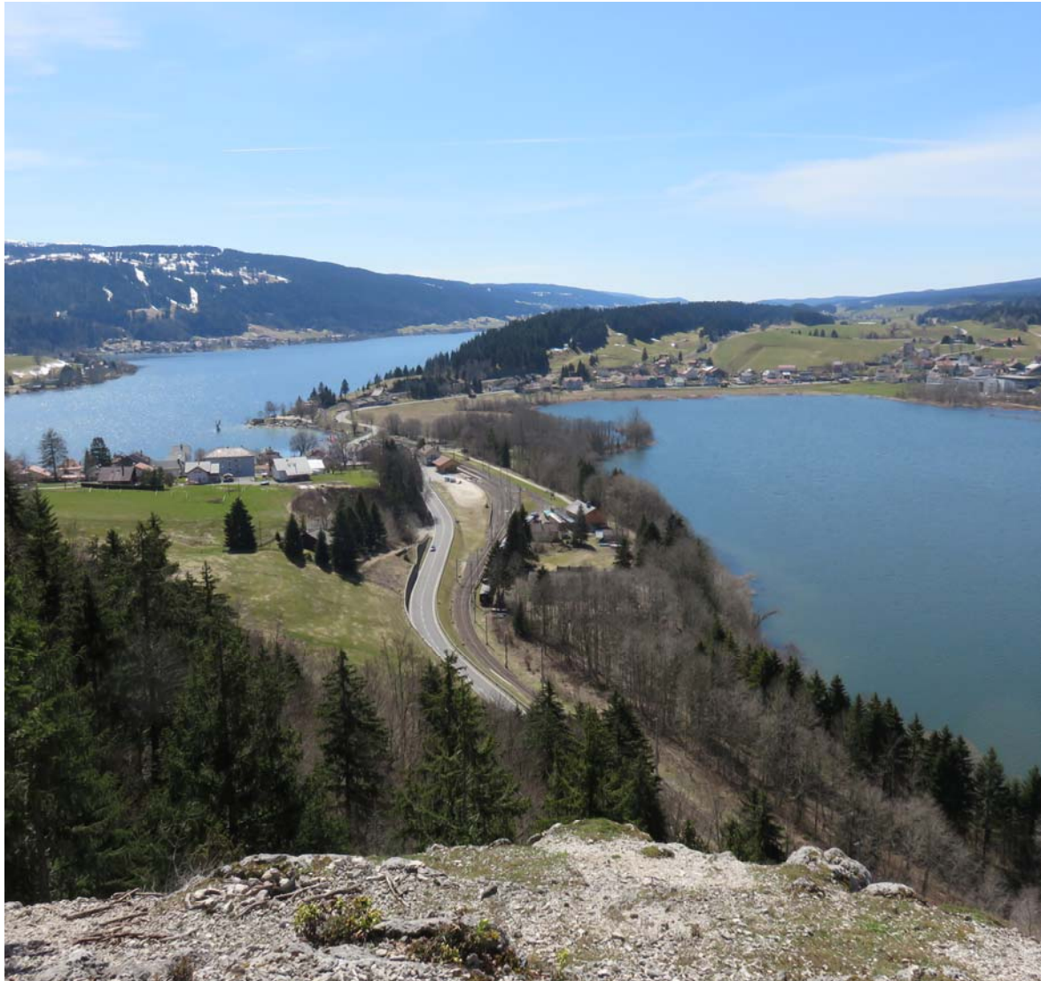
Lac de Joux et Brenet vus depuis la Grenouille.

êtes décidé à l'effectuer depuis le bord du lac Brenet, vous aurez toute occasion de découvrir les difficultés du terrain. A mi course, la Roche à Gahut qui vous offre un coup d'œil insolite sur la région. Tout cela constituant un monde peu couru du touriste, et où vous trouverez bien plutôt quelques chamois en lieu et place d'humains que cet endroit n'attire jamais.